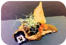
TOKI ALAI Hidalga kalea, 5