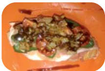
MIRENTXU Hidalga kalea, 10