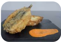
COMPOSTELA San Pedro auzoa, 12